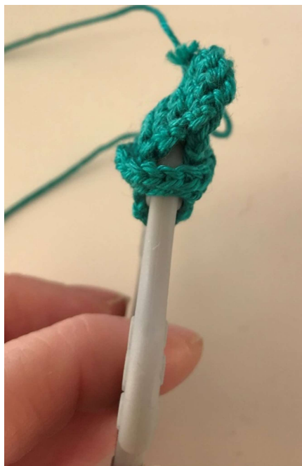
Hovedet inden første omgang (tv), samt efter første omgang (th).